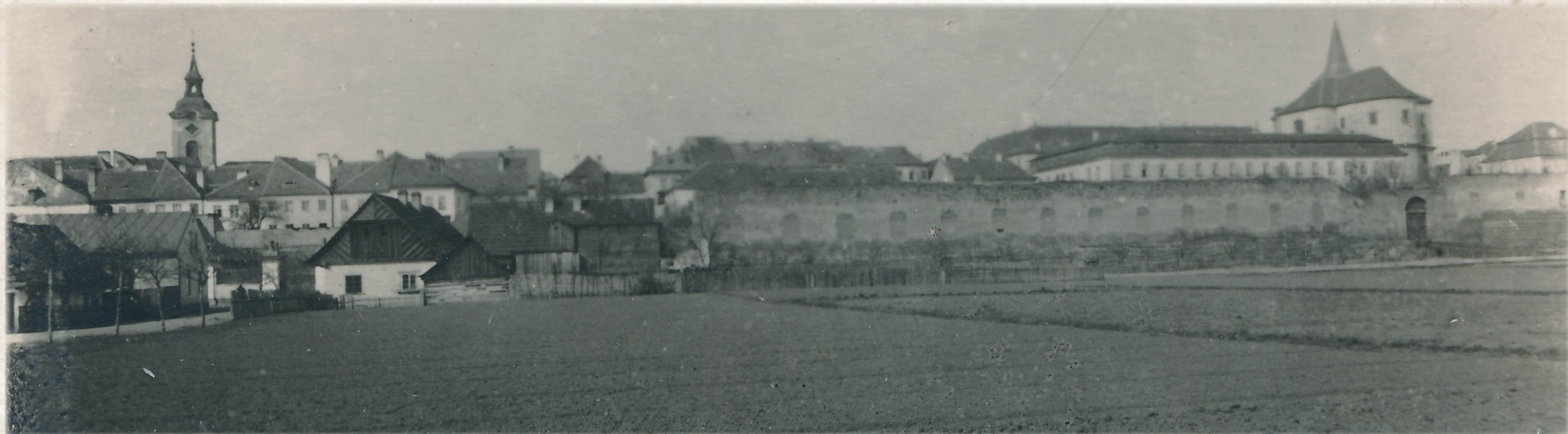
Pohled na Staré Město od Nového Města, před rokem 1894, foto Antonín Brožek (Sbírka RMaG v Jičíně)

Proto se představitelé města kromě finančních nákladů začali zabývat vyhledáním vhodného stavebního pozemku. Nakonec za jako nejvýhodnější vybrala městská rada obecní pozemek vedle poštovní autogaráže.