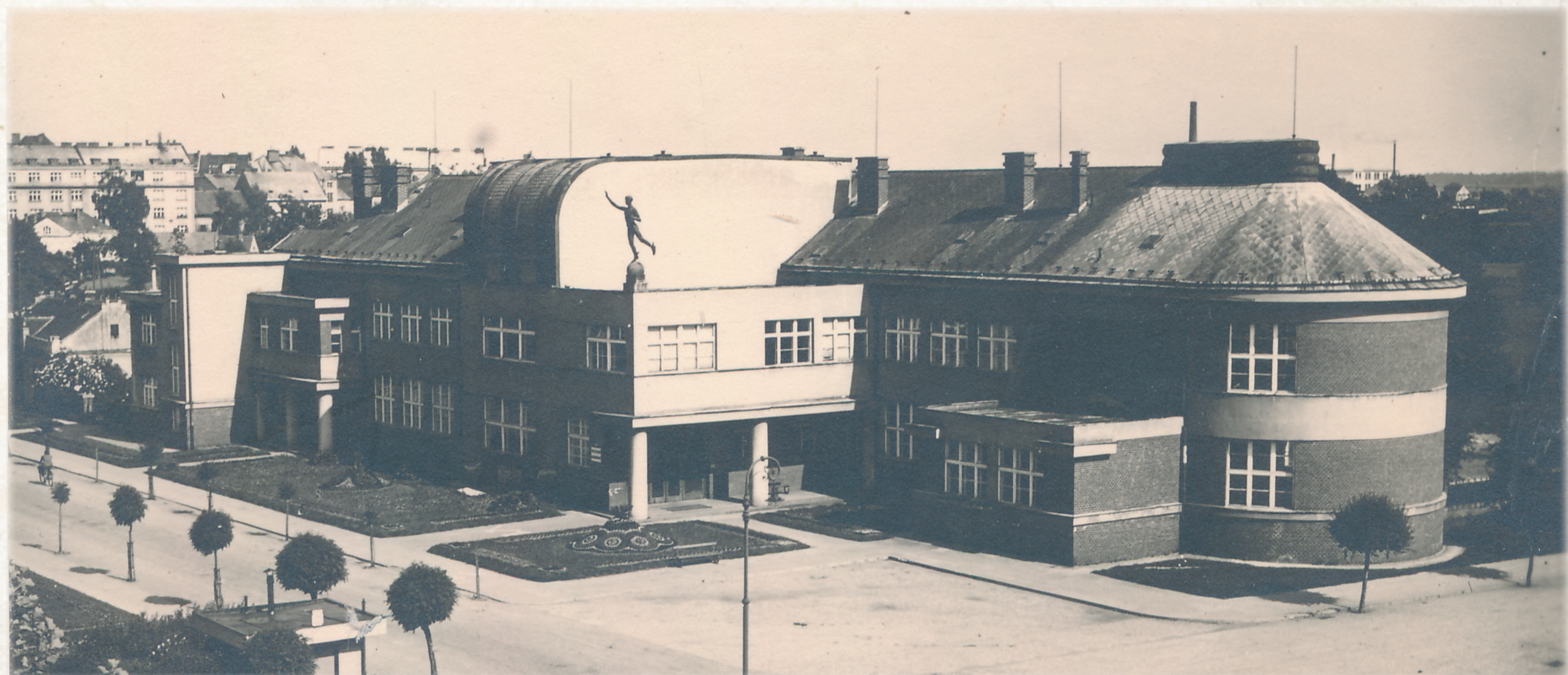
Masarykova veřejná obchodní škola, 30. – 40. léta 20. století (Sbírka RMaG v Jičíně)

Jičín – město škol – nabývá touto budovou nový vzorný ústav, jímž jest postaráno hlavně o výchovu těch, kteří se nemohou odvážiti dlouhého studia. Šťastná mládež, jež vyrůstá v takovém krásném prostředí! Přejeme nové škole, aby mládež našla v ní pravý zdroj vzdělání ducha i srdce, aby z ní vycházela mládež jasného rozhledu, praktického ducha, pilná a pracovitá, jež by jí byla ctí.“