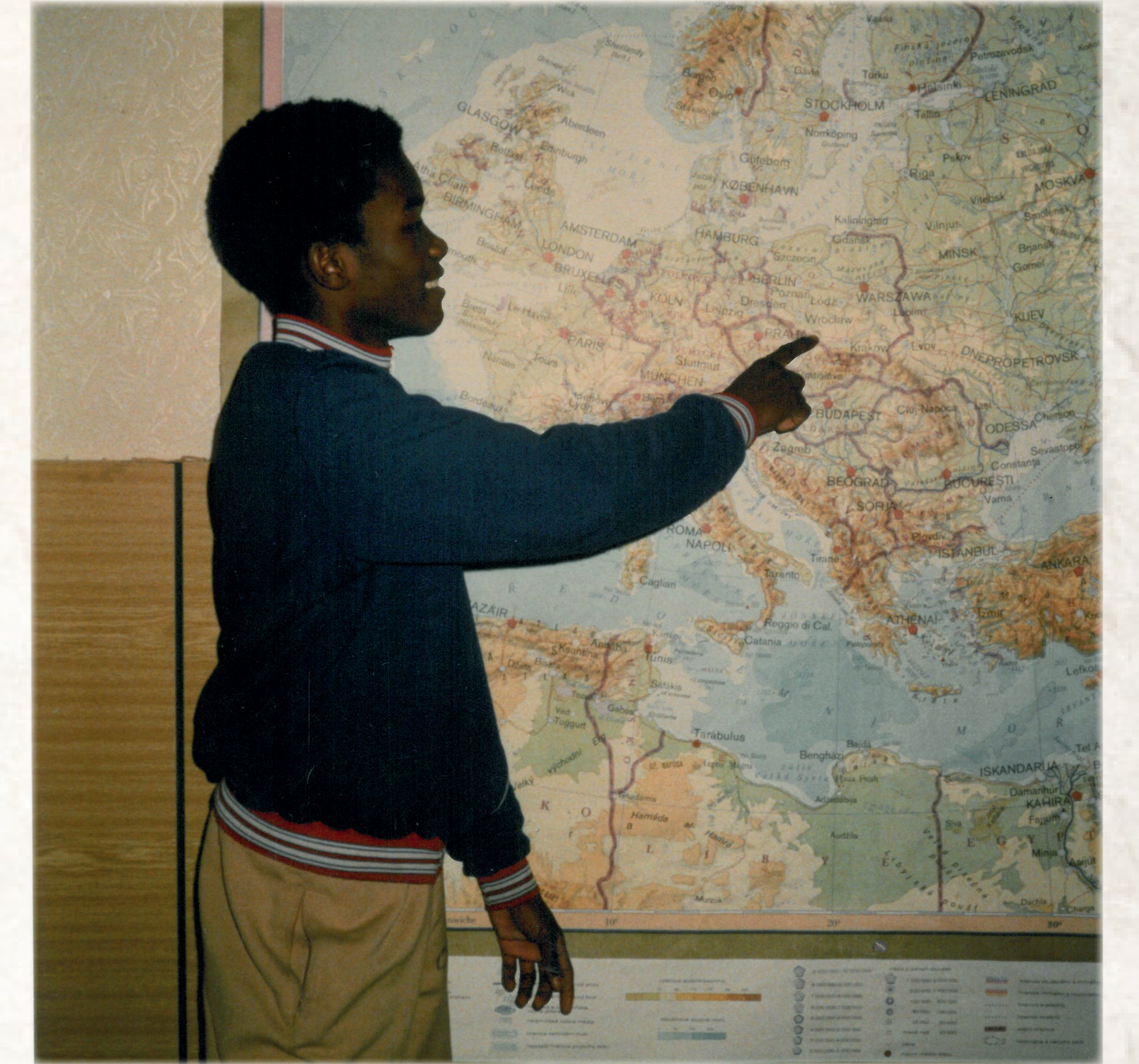
Student u mapy střední Evropy (Sbirka MOA)