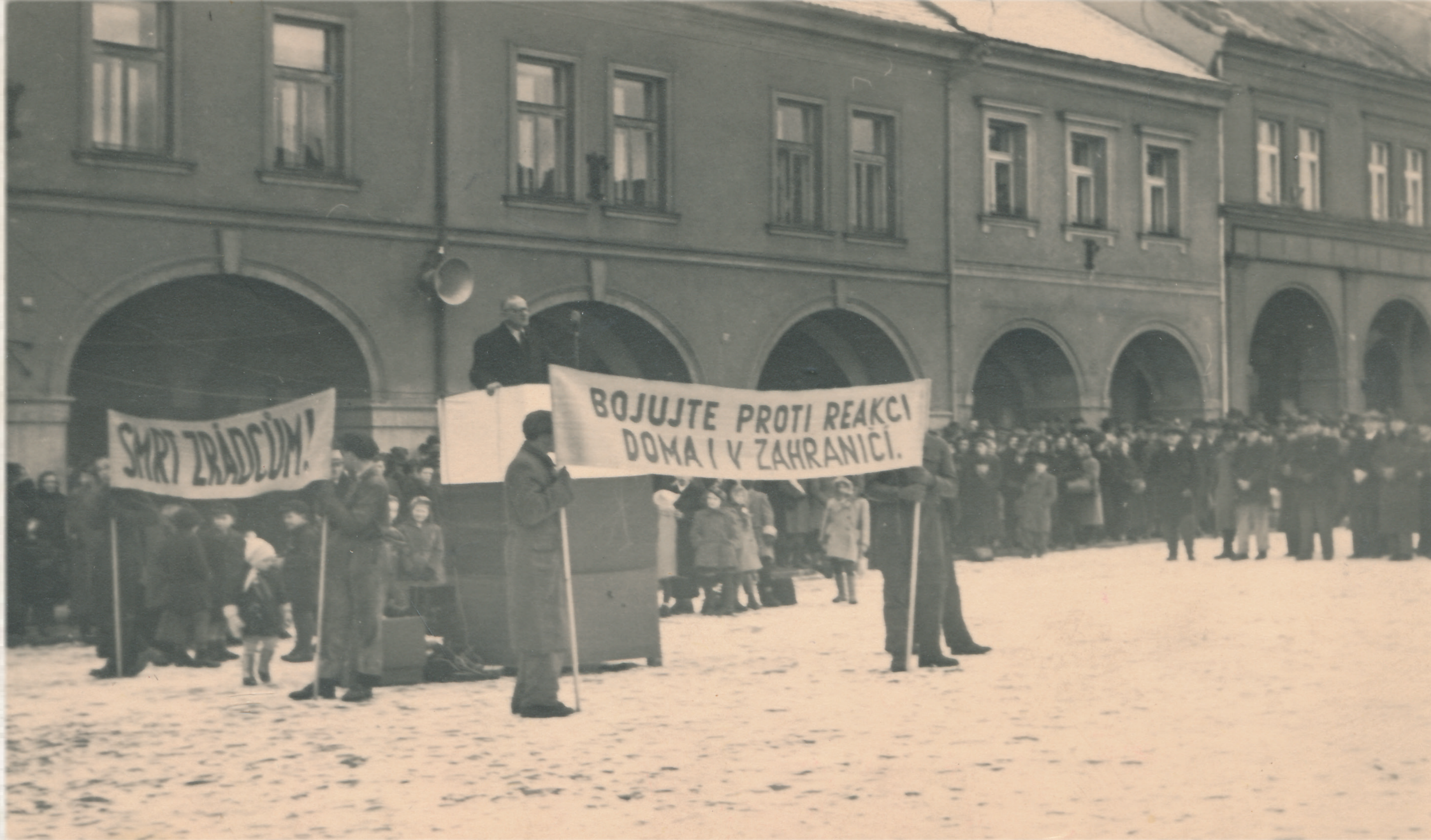
Vítězný únor v Jičíně

Po krátkém období svobody přišla opět diktatura. 25. února 1948 komunisté dovršili převzetí moci v naší poválečné republice. Komunistická totalita zásadně změnila charakter naší školy.