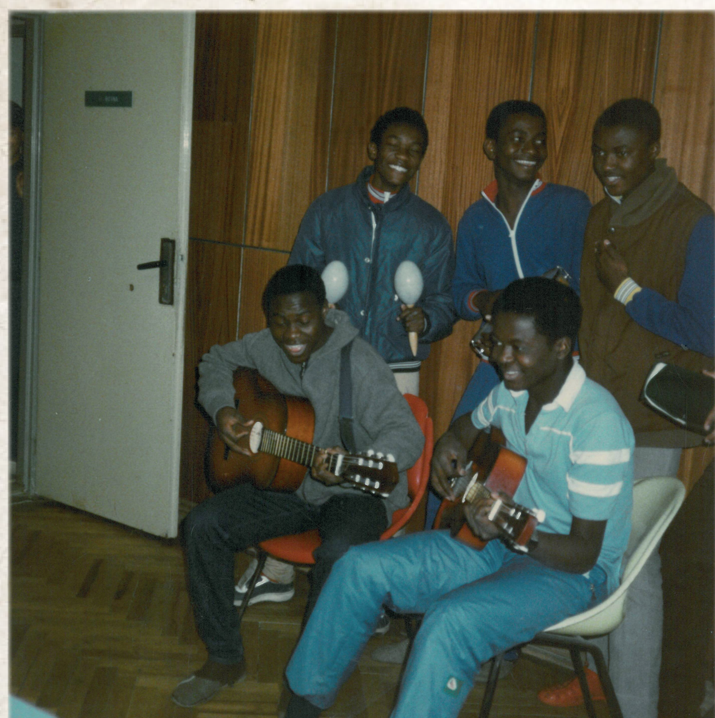
Malý hudební orchestr