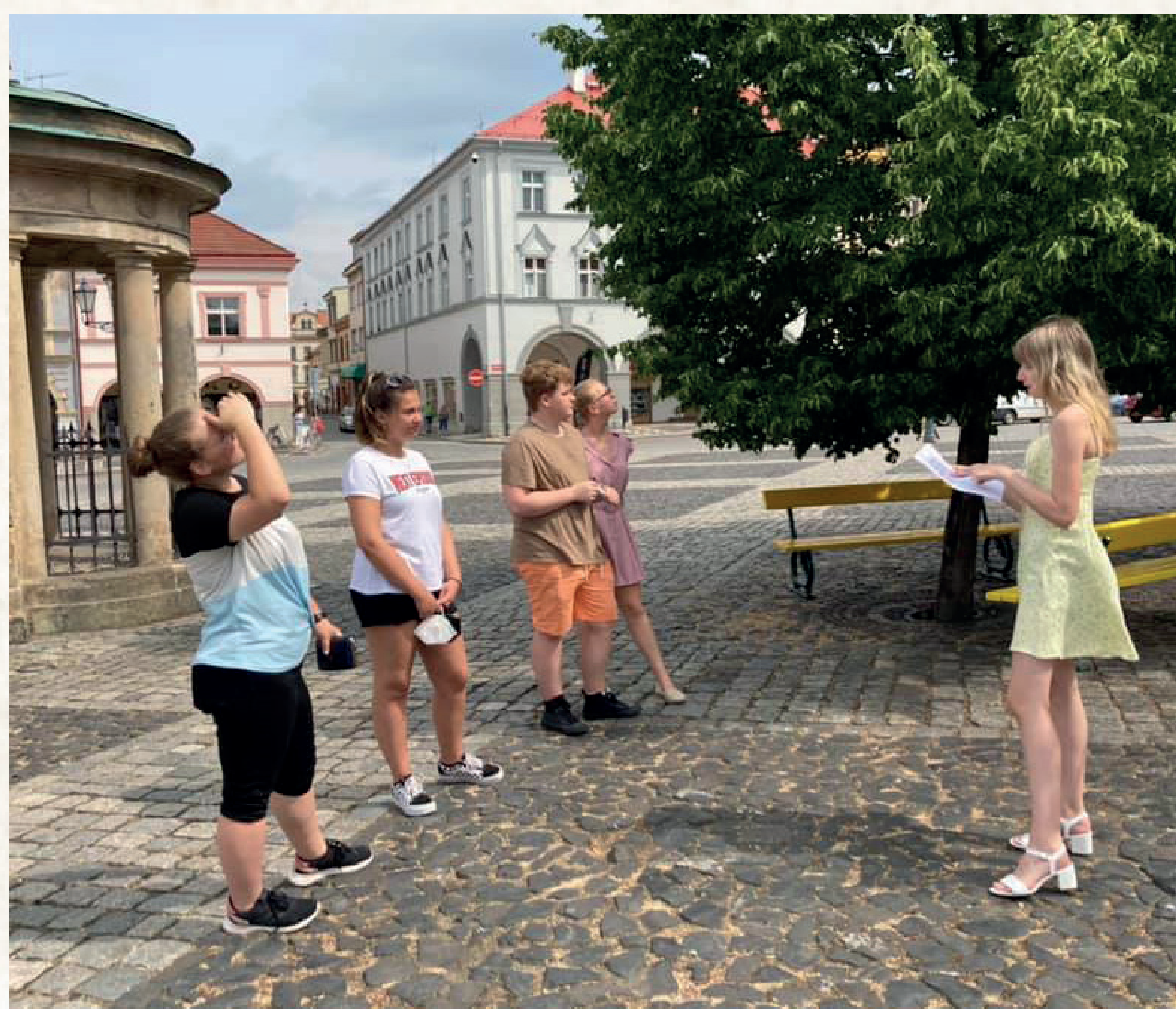
Studentky 3. ročníku při komentované prohlídce Valdštejnova náměstí

Studenti si rovněž samostatně zkoušejí komentované prohlídky pamětihodností Jičína.