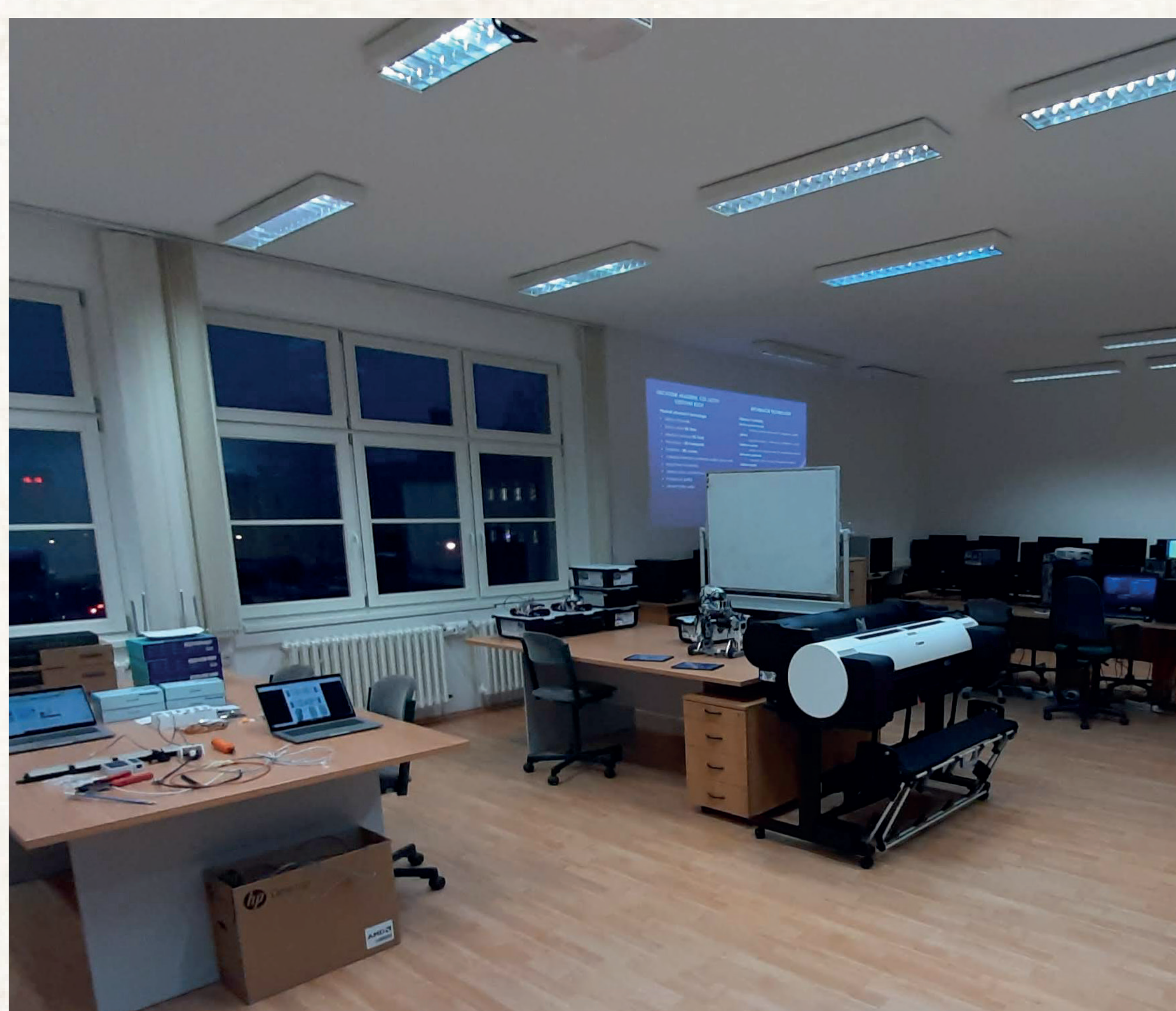
Moderně vybavená IT laboratoř

Své dovednosti si žáci dále rozšiřují o oblast ekonomickou, získají znalosti z účetnictví i z pracovního práva. Nedílnou součástí studijního programu jsou dva cizí jazyky.