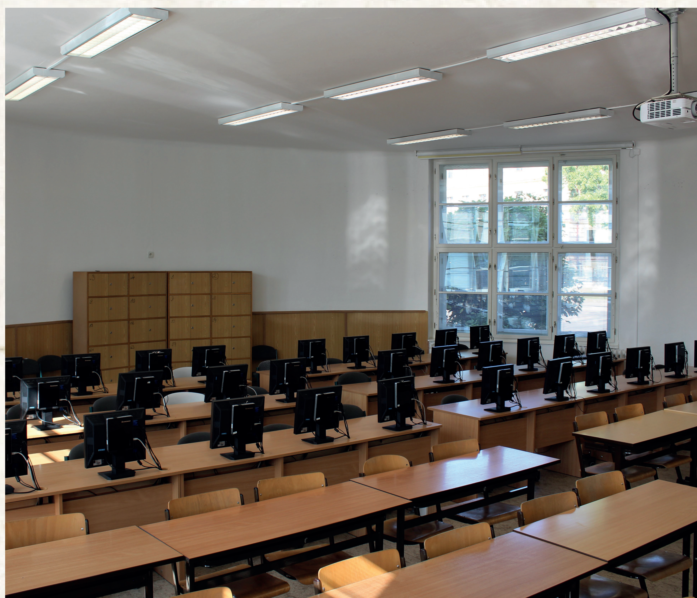
Učebna pro výuku psaní na klávesnici

Během studia si studenti osvojují mnohé praktické dovednosti. Tak například se již v prvním ročníku naučí psát všemi deseti prsty na klávesnici. Ve vyšších ročnících pak mohou z této dovednosti složit státní zkoušku, a to včetně úpravy dokumentů na počítači.