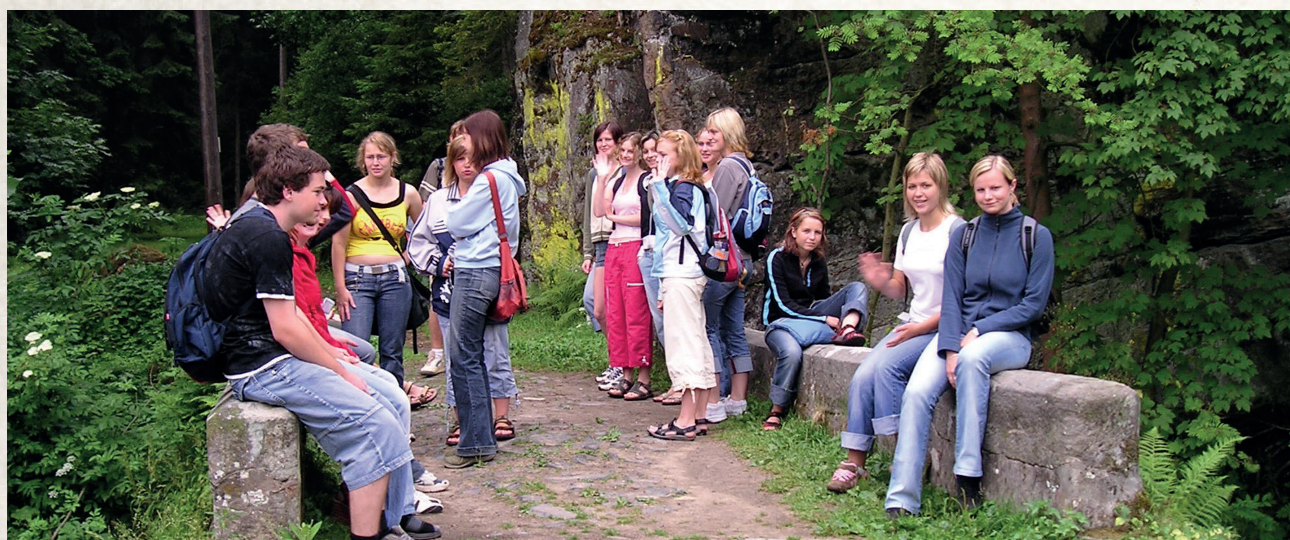
Studenti 2. ročníku při výzkumu využití říčky Žehrovky v rámci projektu Naše sestra voda

V období let 2015 – 2017 pak škola realizovala projekt Erasmus+ Klíč k úspěšnému mezinárodnímu podnikání ve spolupráci s Obchodní akademií v Martině a Alfa-college v nizozemském Hoogeveenu. Do projektu byli zapojeni i zástupci měst a vybraných regionálních firem.