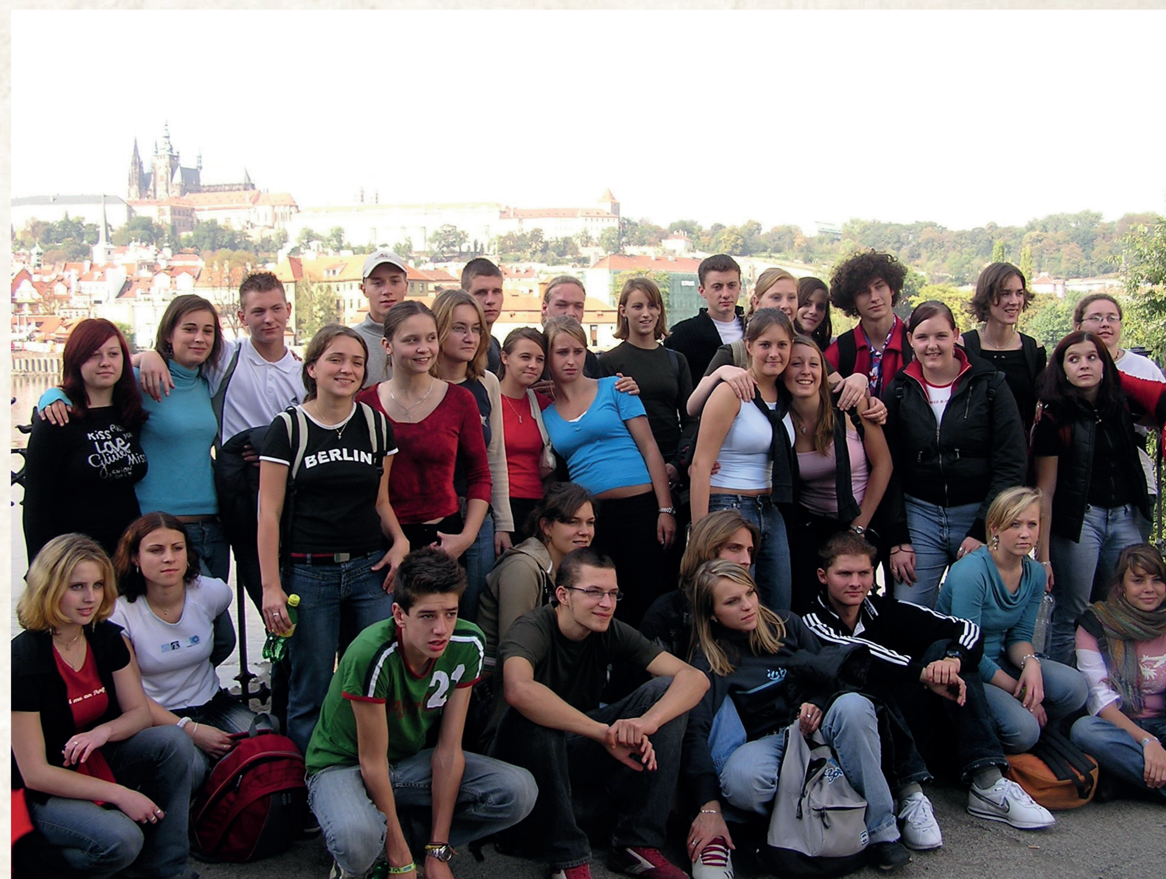
S belgickými studenty na výletě v Praze během výměnného pobytu

K výměnným pobytům s belgickou školou přibyla v roce 2003 obdobná setkání se studenty a pedagogy z nizozemského města Hoogeveen.