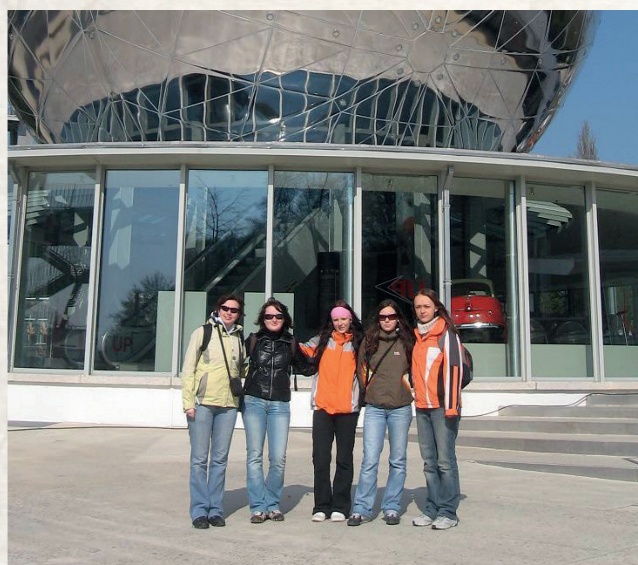
Studentky obchodní akademie u Atomia v Bruselu

V 90. letech se začala Masarykova obchodní akademie orientovat na mezinárodní spolupráci. Nejprve to byly poznávací zájezdy do zemí západní Evropy, na naší škole začali vyučovat rodilí mluvčí. Na počátku nového tisíciletí naše škola vstoupila do projektů Evropské unie a navázala spolupráci se zahraničními školami.