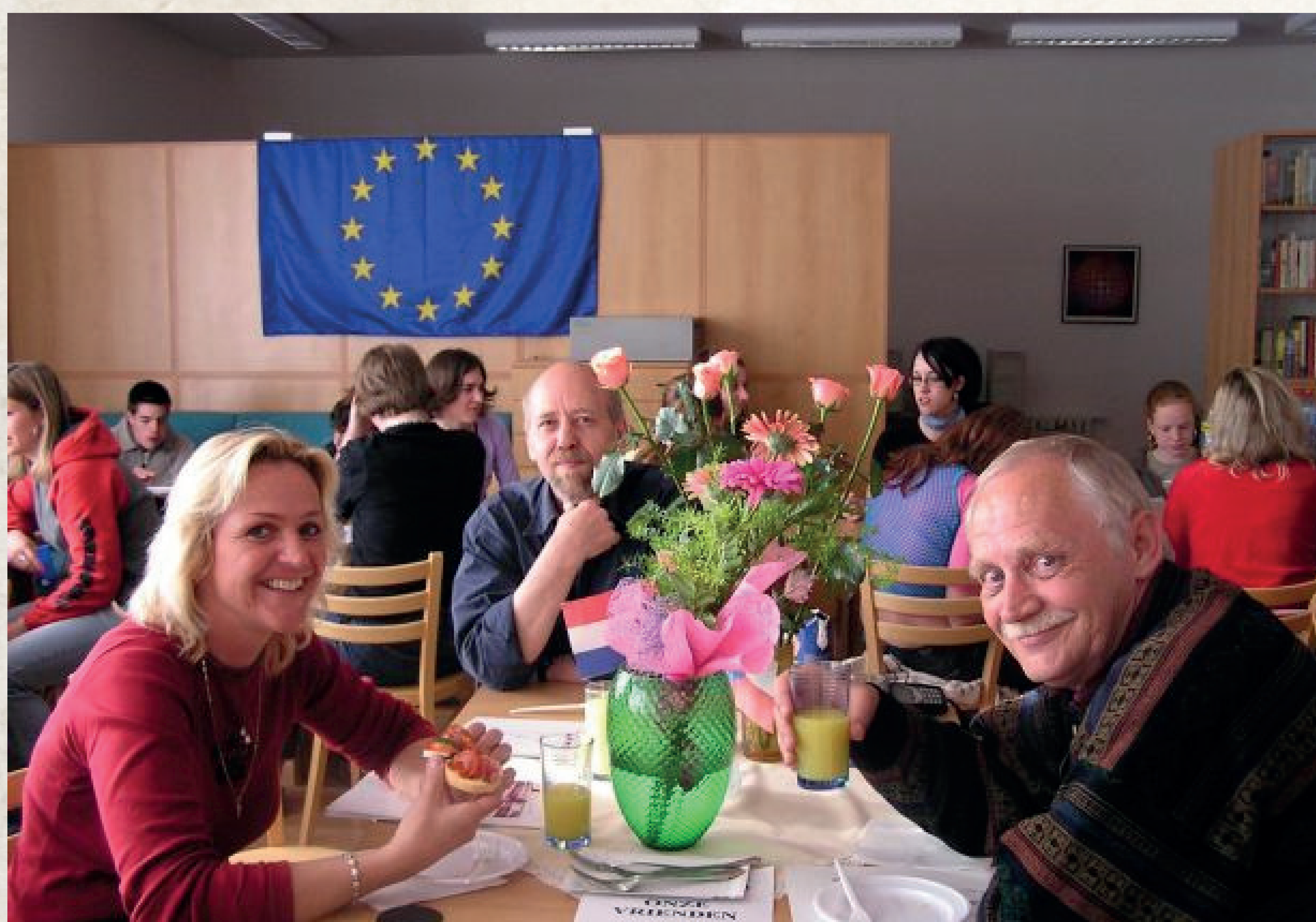
Nizozemští partneři při pracovním setkání na naší škole