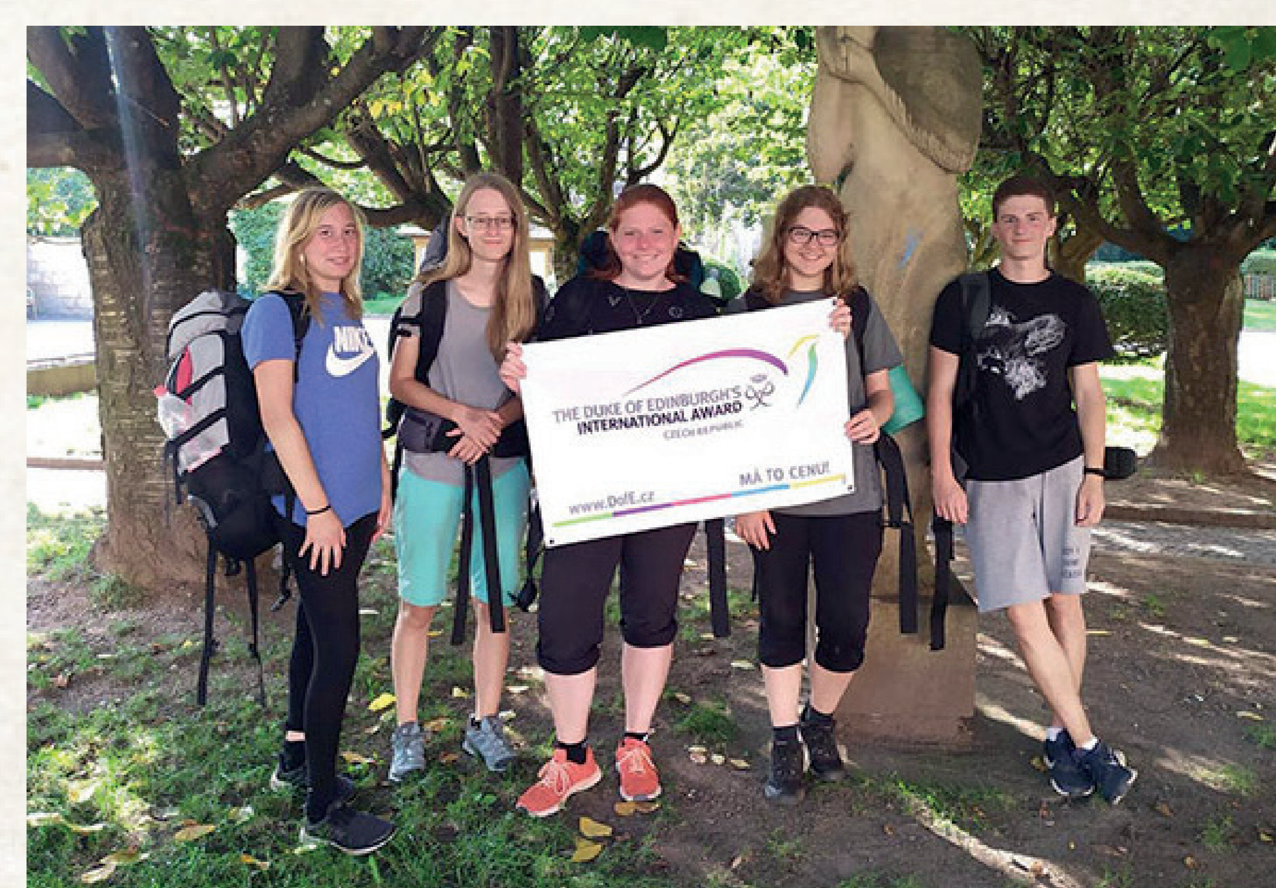
A na konci cesty